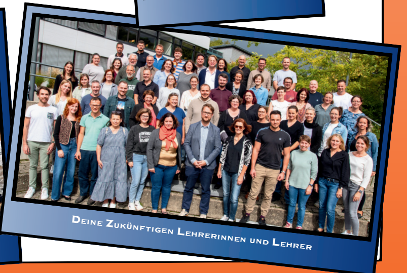
DEINE ZUKÜNFTIGEN LEHRERINNEN UND LEHRER